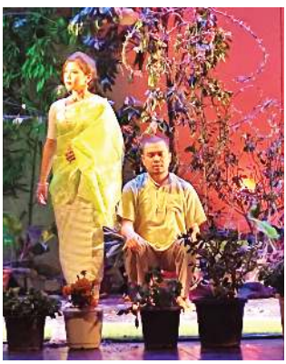
হেথিঙে মমাঙদা মীয়ামদা থমখিৎদু.