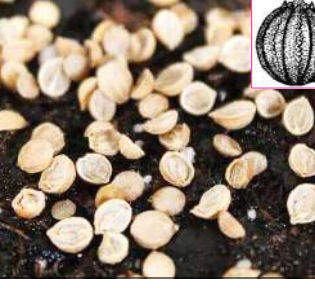
মমু অমসু খেচা কলা মর