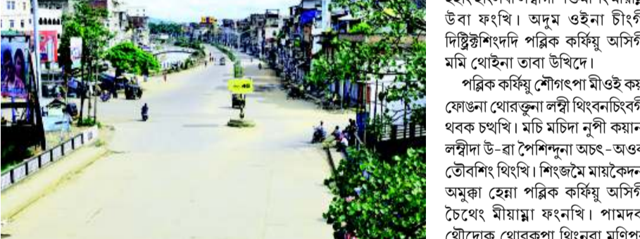
স্টেট অসিগী মক্ৰওইবা লম্বীশিংদা পেসেঞ্জর পুৰা গাড়ী নীংখি নুংগুইনা চেম্বাখিদি। অতোগা স্টেট ফাওনদা চেনখিগদা বস সার্বিসসু লেপখি। অদুমকপু ইম্ফাল অমসুং অতৈ স্টেটশিংগা ফাওনবা ফ্লাইট সার্বিসতি

ইম্ফাল, জুলাই ৩০ (এচ এন এস): ইয়াং-থিঙ্গাইবা যাওনা মীয়ামগী মীফম ফম্বা হোংনবদা পুলিশতা অখিৎবা পীখিবা অমসুং য়েলহৌমী কন্নবা থবক্তা লৈঙল্লতা যৌশা ৰাশাদে হায়না জোইন্ট কমিটি ওন ইয়র লাইন পামিটি সিস্টেম (জে সী আই এল পি এম)না কৌখিবা পুং ২৪গী পল্লিক কৰ্ফিয়ুনা মীয়ামগী পুন্সিরোলদা শাখিবা চৈথেং পীখ্লে।