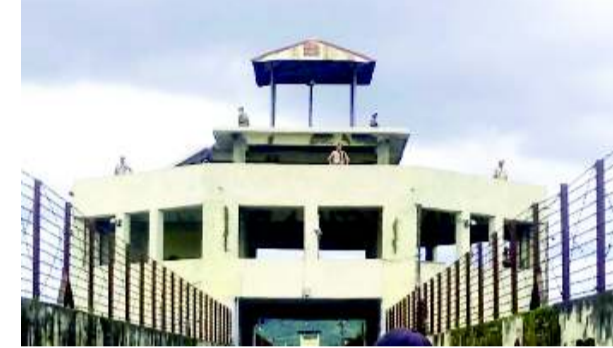
লৈবা মচোয় অহুম খংনকপদগী সাউদি অরাবিয়া মচা অনী অদুনা থাংমিলিয়ন জৌগী মকোক্তা অরুনা পোৎশক অমনা থোমদুনা হাংখি। চৈনা খাংবা গুদমবদগী লাউ-খোংবা তানরকপদগী সেক্সন টু, থ্রি অমসুং ফোরদা লৈবা ফাদোকশিংনা মচোয়গী যৌকী গেট নমখায়দুনা থোরক্কা সেক্সন রানগী ওইশুবা সেলাদ লৈবা সাউদি অরাবিয়া মচা অদুনা মী হাংলুবগী কেসতা চেম্বরদগীদমক অন্দর টাইয়েল প্রিজনার ওইনা জেল অসিদা লৈরকখিবনি হায়রি।

ইম্ফাল, জুলাই ৩০ (এচ এন এস): ইম্ফাল ইষ্ট দিষ্ট্রিক্তী মনুং চনবা হেঙাং পুলিশ স্টেশনা কোনবা শজিরা সেটেল জেলদা হৌখিবা নোংয়াই মতুং পুং ১ তাবদা ফাদোক মশেল পুং থোকরকপদা সাউদি অরাবিয়া মচা অনী অমসুং চুচাচাম্পদগী অমা পুন্না ফাদোক অহুম শিরে।