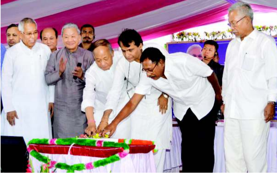
ইম্ফাল ফাওবগী রেলরে লাইন যৌরক বগীদমক অখন্নবা মীংয়েং চঙলকি। ইম্ফালদগী মোরে ফাওবা রেলরে লাইন যৌরক বগীদমক মীংয়েং চঙলকি।

ইম্ফাল, জুলাই ৩০ (এচ এন এস): ইম্ফাল-মোরে রেলরে লাইন শেমগংনবগীদমক ফাইনান্স মিনিষ্ট্রিদা পুখৎকনি। মসি শেমগংনদা লুপা ক্রোর লীশিং ৯ লোম চঙলদা যাইপারি হায়না যুনিয়ন রেলরে মিনিষ্ট্রি সুরেশ প্রভাকর প্রভুনা গুসি ইম্ফালদা রেলরে স্টেশন বিল্ডিং শানবা উরেপ উয়ুং তম্বা অমদি ইন্দিয়াগী স্বাইদগী শাংবা রেলরে টনেল ওইগদৌরিবা টনেল নম্বর টি-১২ কী থবক হৌদোকপগী যৌরমদা ফোঙদোকপে।