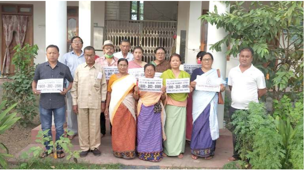
যৌৱাল দিক্ৰিষ্ট মহিলা কোংগ্ৰেস কমিটিনা অৱাৰা অৱবা নুশিগুং মজে পাঙনবগী টেল ফ্ৰি হেল্লাইন নম্বৰ (১৮০০২০৩০৫৮৯) এস টি আৰ ষ্ট ষ্ট লোঞ্চ তৈখিবা

অমৰোমদা সী পি আইগী লুচিংবা মনিক সৰকাৰনা ফোঙদোক্ৰিবা, বি জে পিগী ওইবা লৈঙাক লাক্ৰিবিদগী ষ্টেট অসিদা ভাইওলেদকী ওইবা থৌওংশিং থোকপগী চাং য়াম্মা ৰাংখংলেক্ৰে। মীচম মীয়ামগী ৰাফম থাদেক্ৰুগা সিক্ৰিটি য়াওনা চংলিবা ওপোজিসনদা লৈবা পাৰ্টিশিংগী এম এল এ অমদি পাৰ্টিলিডৰশিংনা ফাওবা বি জে পিগী খুনেক ওইনা লৈৱিবা গেং থুংপুশিংনা ক্ৰিচন খঙহনবা অমদি নুংখিল মীয়াম্মা তিনবা মতমদা ফাওবা এটেক্ৰ চখাৰি। মৰম অদুনা অসিগুগা মীয়ামগী খন্দবা বি জে পিগী লৈঙাক অসিবু মীয়াম্মা পাৰা তন্ত্ৰীবা মতম ওইৱে হায়ৰি।