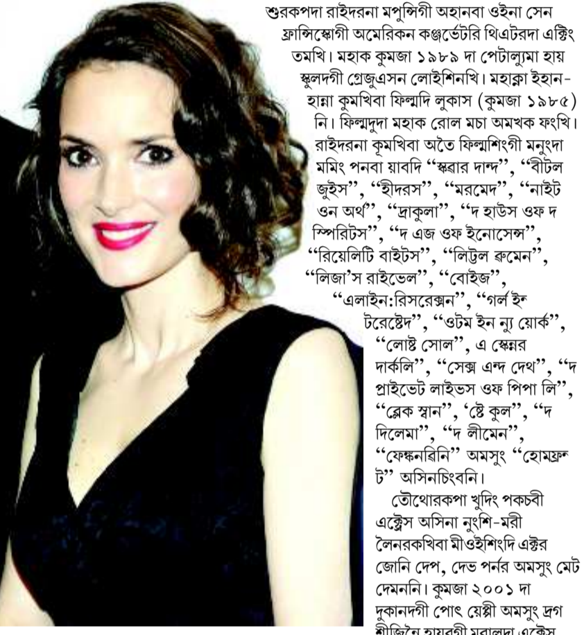
অসি ফারগা টাইইল চংখখি। মরাল লৈরক্ৰিবী ফাসন হীহনখিবগা লোয়ননা চৈরাক ফাওবা ফংখি।