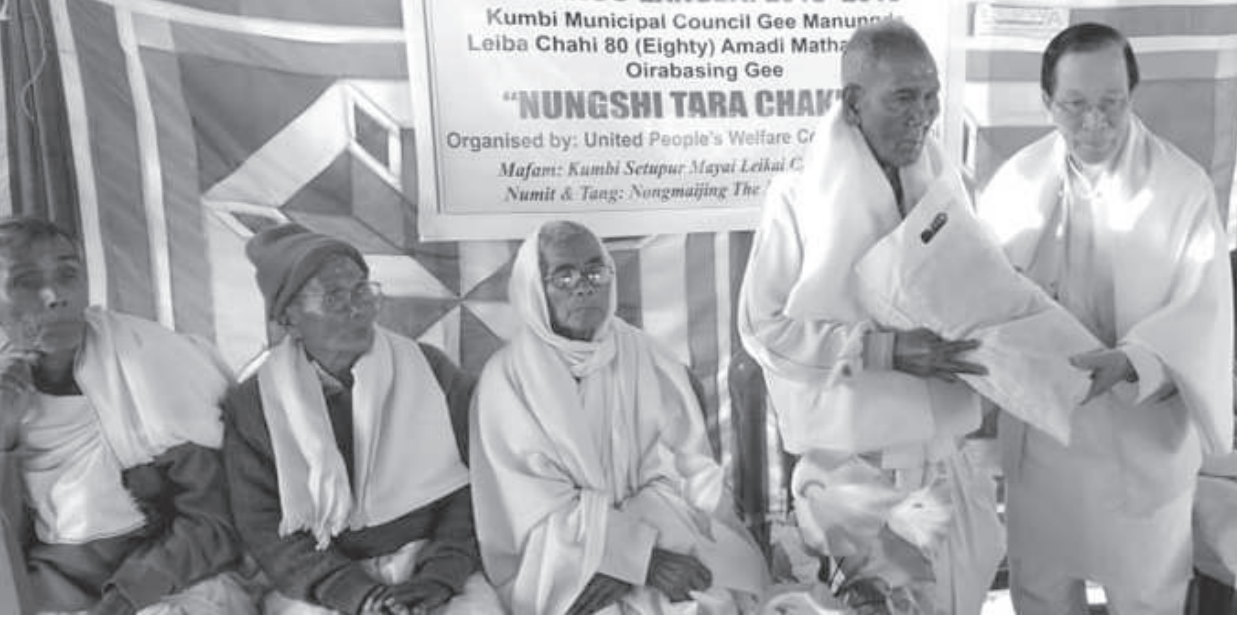
মুনাইটেদ পিপালস ব্লেলফোর কমিটি, কুইনা শীন্দুনা কুই শেতপুৰ ময়ায় লেকাই কম্যুনিটি হোলদা অহল ওইৰবশিংদা নুংশি তৰা চাৰ্কেদ চামিন্নবগী থৌৰমদা শৰুক থাখিবা অহলশিংদা খুদোল তহুগী শক্তম

ট্রাংমুং/খোঙ তোয়না তোয়না হায়া, করিগুয়া অমা চাশিনবা মতমদা খোঙ হেত্তা হাম্মিংবা, অমাঙথোং ময়াদা পোমখোক্তা লোবা, খোঙ হায়া খুদিংগী ঈ দ্রোপ দ্রোপ তারকপা, অমাঙথোংগী অকোয়বদসু মরেং মরেং চংলগা হাক্কংচবা ফহনবগী ওজা জিয়া উল হকপু থাগৎচরি