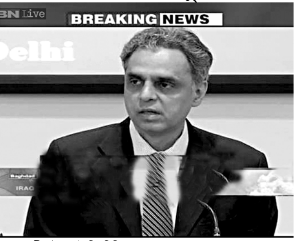
কমার্সগী ওইবা পাইশিং শিজিমদুনা ভোলুন্টরি বেসিনত লৈবাক অদ্ থাদোরকবা খঙনশ্বে। যৌও অসি তৌবদা সেক ওইগনি খল্লবদি মখোয়না চল চাবা থবক পায়খনব খঙনখিবনি। মখা তানা নোটিশ খোজিবকাওবা ইরাক্কী চহনবা ইন্দিয়া মচাশিংদা পাউতক পীয়ে। ইরবিল, বাগদাদ, বস্কা অমসুং নজাদত লৈবা সত্ৰশিংদা লৈরিবা এররপাটিংগী হৌজিক থবক