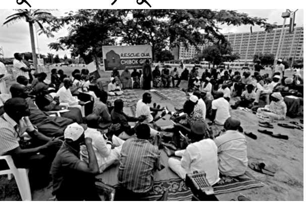
কাউন্সিল বোকো হারামগী মায়কৈদগী নুমিং খুদিংগী ওইনা চথরকিবা এটেকশিং লাকশিবনা গুমনা লৈরি। কুমাবজাদা লৈবা অজি খালিল কৌবা মীওই অমদা গুসি ফোঙদোরকখিবদা মিলিটেন্টন জিনবশিং অদুনা খুঙ্গ ৪ দা এটেক তৌরজুনা খুগ্না ৪ হাংখিবা হৌখিবা থাংজ নুমিত্তা কিদনেপিংগী

মহিগুপ্তি, জুন ২৪ঃ ইসলামিক এক্সট্রিমিষ্টশিংনা অরাং নোংপোক থংবা নাইজেরিয়াদা লৈবা খুঙ্গশিংদগী লৈশাবী য়াওনা নুপী ৬০ অমসুং নুপামচা ৩১ অমগা কিদনেপ তৌখে হায়না যৌদোক অদু উইহা মীওইশিংদা গুসি ফোঙদোরকশ্বে। সিক্যারিটি ফোর্সনদি কিদনেপিংগী যৌদোক থোকখিবা অমত্ লৈতে হায়না রাফম অদু য়ানিবদা ফোঙদোরকশ্বে। নাইজেরিয়াদা গভর্ণমেন্ট অমসুং মিলিটরিনা হৌখিবা এপ্রিল ১৫ দা ফুল তল্লিবা নুপীমচা ২০০ হুয়া ফাদুনা পুথিবা অদুগী মতাংদা পাউমু পীদবা পহুহল্লি হায়না মায়াদা পাক শয়া ক্রিটিসাইজ তৌরবা লৈরকিবনি। বোৰ্ণো টেটকী কেপিটেল ওইরবা মহিগুপ্তিগী কিলোমিটার ১৫০ লাগ্না লৈবা কুমাবজাদগী ফংখিবা রিপোর্ট অসিগী মতাংদা ইন্দিপেন্ডেন্ট ওইনা কনকর্মে তৌবদি লৈরি। মিলিটরি গুপ্ট ইফ জেঙ্গিগী হেদ