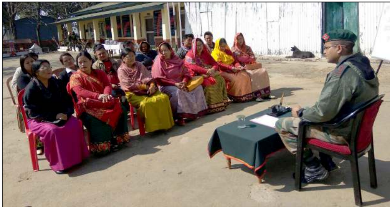
কাঞ্চিপুৰদা লৈবা ৬শুবা এ আৱগী পাৰ্সনেলশিংনা প্ৰধানশিং, মৈৱা পায়বীশিং অমসুং ৱাৰ্দ মেম্বৰশিংগা লোয়না লো এন্ড ওৰ্ডৰগী মতাংদা ৰা খনবগী শক্তম