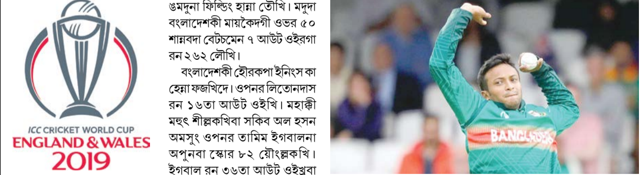
সাইথমর্টন, জুন ২৪ (এজেলী):

পাঞ্জল ৭-০দা থৌইখি। কনাদাগী মাং কৈ দগী দেবিদ অমসুং কাবালিনিনা হেটট্রিক ফখখি। মেচকী ৩শুবা মিনটতা দেবিদনা একাউন্ট হাংদোকখি। মদুগী মখা তারকপদা কবালিনিনা শাল্লগী ১১ শুবা, ৪৩ শুবা অমসুং হাফ অদুগী ইঞ্জুরিটাইগী অহৌবা মিনটতা পাঞ্জল ৩ চন্দুনা হাফ