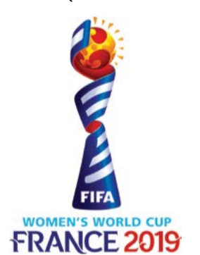
লি হর্ভে, জুন ২৪ (এজেলী):

ফ্রান্সনা য়ুসু ওইদুনা লৈবাক অদুগী তোঙান-তোঙানবা সিটিশিংদা পাঙথোকলিবা ফিফা ক্রমেল বর্ল্ড কপ ফুটবোল টুর্নামেন্টকী ৮লক শুবা এডিসনগী ওয়াং অথেংবদা শাল্লখিবা পি ক্বার্টর ফাইনেল চেচ অমদা ব্রাজিলবু এক্সত্রা টাইমদা মায়থীবা পীদুনা ক্বার্টর ফাইনেল য়ৌবা ওমগে। মেচ অদুগী মাং ওইননা ইংলেদনা কেমনন পাঞ্জল ৩-০দা থৌইদুনা মখোয়সু ক্বার্টর য়ৌবা ওমগে।