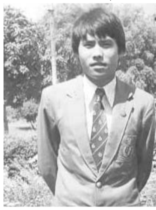
অদুব মতমদা য়াঙমাশো সৈজ না চীফ মিনিষ্টর ওইরি। ফাইনাল মিনিষ্টরনা অজিমুদিননা পায়। য়াল্লাম য়াইমানা লো মিনিষ্টর ওই। ও জয়না দেপুটি স্পিকর, ডা. চন্দ্রমনিনা আই এফ সি দি পায়রি। এখোয়না টেবল টেনিসকী টুর্নামেন্ট অমা লৈখিদিব্দু মরুপ ঈশ্বরচন্দ্রগী মমিংদা পাঙথোকচগে হায়বসিদা অতৈ অতৈ মিনিষ্টর অঙম-অথৌ কয়াদি হরাও হরাও অঙুশা শেনফম হাঞ্জিরকখি। অদুব মতমদুনা লো মিনিষ্টর ওইবিখিবা পাঙ ওইনাম য়াইমদি করি খল্লবগীনা খঙদে, সুপুংগী লুপা ১০ খঙ হাঞ্জিরকখি।