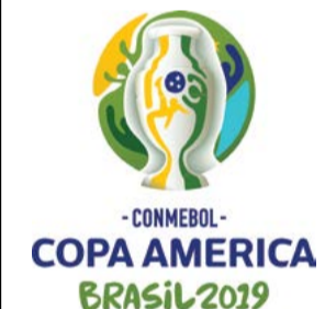
পোর্টো এলেক্সি, জুন ২৪ (এজেলী):

ব্রাজিলনা য়ুসু ওইদুনা থা অসিগী ১৪দগী হৌখিবা কোপা অমেরিকা ফুটবোল টুর্নামেন্টকী ওয়াং অথেংবদা শাল্লখিবা গ্রুপ 'বি'গী অরোইবা গ্রুপ মেচতা অর্জেন্টিনানা কটার পাঞ্জল ২-০দা মায়থীবা পীখিবা অমসুং কলম্বিয়ানা পেরাখে পাঞ্জল ১-০দা থৌইদুনা গ্রুপ অসিগী টিম অনীশ্বাক ক্বার্টর ফাইনেল য়ৌবা ওমগে।