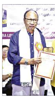
ইম্ফাল, মে ৩১ (ঐচএনএস) : মরম চারবদি বারী শানসি হায়না চীফ মিনিষ্টর রাই খেমচান্দনা ফোঙদোকপ্তে।

ইম্ফাল, মে ৩১ (ঐচএনএস) : বন্দগী খোঙজং তোক্লিসি, মসিনা নোংমগী শু-নোমদুনা হিংলিবা ইম্ফাং অমদি মহৈরোয়শিংদা চাউনা মাঙলুই হায়রাদনা মরম চারবদি বারী শানসি হায়না চীফ মিনিষ্টর রাই খেমচান্দনা ফোঙদোকপ্তে।