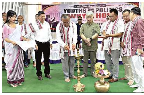
পুৱাৱীদা অমুক্তা থেংনখিদিবা অমনি। মীতৈ ফুকপা ক্বলাতোংবি লামা চংপা ওমদনা লৈরকিবা অসি লায়না লৌফম থোক্তে। অসিগুস্তা ক্বীঅসি উকবদা য়াঙ্গা নীংবা কায়াবা অমা ওই হায়রাদনা গুসি মণিপুরদা থেংনখিবা অমদি ওইরিবা ক্বীঅম অসি মক ওইনা স্টেট অসিগী এদুকপে সিস্টেম শোয়রকপদগী।