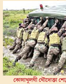
কোসাখুলগী থোদোজা শোক্কা খুঞ্জাবু সেলেস ফোর্সনা হোম্পিটালদা পুরুরা হোংখিবিহনি হায়না সোল শীদিয়ায় ভাইফেল ওইরকখিবা ফোনে।

ইম্ফাল, মে ৩১ (ঐচএনএস) : খুংলায় পায়বশিংনা মীচমদা তংতনা খুং থারকপদা লৈঙাক্সা এক্সন অমতা লৌদ্রবদি খাওবা ওম্মক্কা মীয়াঙ্গা সিভিল বার থোকহল্লকপগী ক্বীঅমদা লায়কপদা অমসুং খাঙ্গা বাগদবা ঈরাং থোরকবগী মচাক ওইরকনি হায়না কোসাখুলগী চেরমেন দি অদাম লিয়াংমাইনা ফোঙদোকপ্তে।