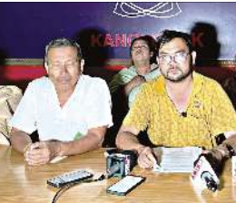
মতুংইমা ওইহামগী মণিপুরগী দিষ্টিক্টশিংদা এস আই আরগীদক য়ুমথোং খুদিমন্তা য়েংনবা লাক্সিবা ইন্যুমরেশনগী ফোর্ম অসি ভোটেশিংনা মেঞ্জগা বি এল ওশিংদা পীরাবা মতুংদা ওনলাইন পোর্টেল মোদাতা সবমিট তৌগবনি।

ইম্ফাল, মে ৩১ (ঐচএনএস) : ইলেজ্ঞন কমিশন ওফ ইন্দিয়া (ঈ সী আই) গী পাউতাক মতুংইমা ওইহামগী মণিপুরদা হৌখিবা স্পেশাল ইন্সপেক্টিভ রিভিজন (এস আই আর) গী ইন্যুমরেশনগী থবক পীবা ফোন নম্বরদা মরী লৈনবা বৃট ভেলেল ওফিসর (বি এল ও) গী নত্তবা অতোপ্পা মীওইগী টেলিফোন নম্বর যাওরলে থেংনে হায়রদুনা রাথোক ওইদ্রিঙেদা মরী লৈনবশিংনা মীংয়েং চত্বীয়া হায়না লুপ ১৪গী কনভেন্সন শান্ত নহাকপদনা ফোঙদোকপ্তে।