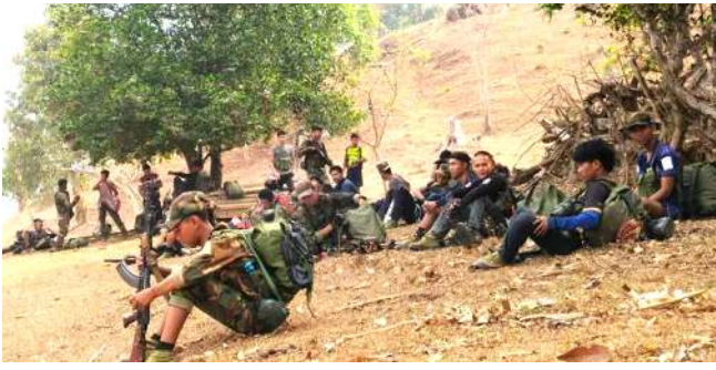
ম্যান্ডার হস্তাঙ্গী লুচিবা সেনিয়ার জেনারেল মিন উং লেইংনা গুৱাং থোকখিবা চেৱোল অমদা লৈবাক অসিনা যুহা হাবগী মীওই ২,৮০০গী মখতজা শিন্দনা অৱা-অনা কমা মায়োক্কবসু লৈবাক অসিবু গুৱাংকোৱবগীদমক মখা তানা মিলিটারি ওপারেসনশিং চখথিগনি হায়শ্রৈ।

মন্দলে, এপ্রিল ০২ (এজেসী): ম্যান্ডার হস্তাঙ্গী লুচিবা সেনিয়ার জেনারেল মিন উং লেইংনা গুৱাং থোকখিবা চেৱোল অমদা লৈবাক অসিনা যুহা হাবগী মীওই ২,৮০০গী মখতজা শিন্দনা অৱা-অনা কমা মায়োক্কবসু লৈবাক অসিবু গুৱাংকোৱবগীদমক মখা তানা মিলিটারি ওপারেসনশিং চখথিগনি হায়শ্রৈ।