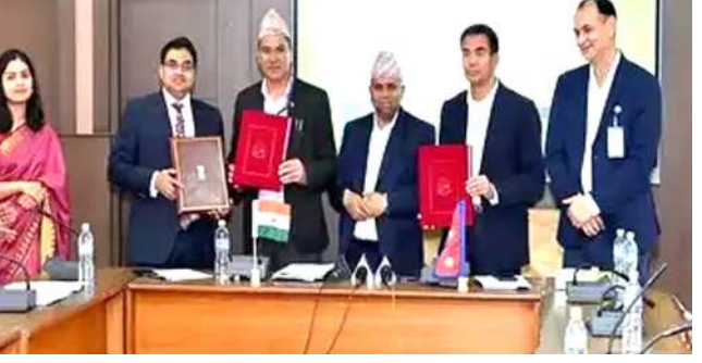
লৈবাক অনীগী মরুপ মপাং ওইবগী মৰী হোৱা পাকথোক চাওখোক্কবগী পান্দমদা তৌঙান তৌঙানবা চাওখং থৌৱাংগী মতাংদা মেমেৱেদে গুফ অন্ডষ্টেদিং (এম ও য়ু)শিং খুংয়েক পীনশ্ৰে হায়রি।

কাঠমন্ডু, এপ্রিল ০২ (এজেসী): নেপাল অমসুং ইন্দিয়ানা লৈবাক অনীগী মরুপ মপাং ওইবগী মৰী হোৱা পাকথোক চাওখোক্কবগী পান্দমদা তৌঙান তৌঙানবা চাওখং থৌৱাংগী মতাংদা মেমেৱেদে গুফ অন্ডষ্টেদিং (এম ও য়ু)শিং খুংয়েক পীনশ্ৰে হায়রি।