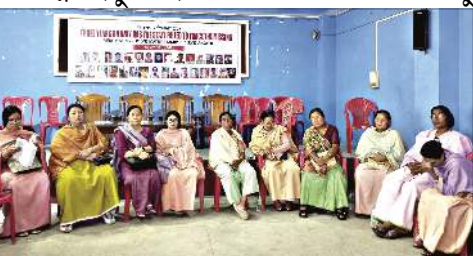
পাউগী মীফম অসিদা মহাক্লি হায়, এগী ...মখা লমায় ৩ কলম ২

ইম্ফাল, মে ০২ (এইচএনএস) : হ্যামেন রাইটস ইনিসিটিভ (এচ আর আই) না মে ৩, ২০২৩দগী হৌরকখিবা লান অসিগী মনুংদা থোকপা থৌদোকশিংদগী মফম খঙখিচিবা মীওই ৩০ হেনবগী 'ফেমিলিজ ওফ মিসিং পাসর্স' গীদমক শিন্দনা পাণ্ডথোকখিবা পাউগী মীফমদা মফম খঙখিচিবা মীওইশিংগী মনুংদা য়াওরিবা খুংয়ে কেইখেলদগী অতোম সোমোরোদ্রোইগী লোয়নবা অতোম ওংবী কবিতানা মহাক্লি মপুৱোইবগী দেখ সার্টিফিকেট লৈঙক্ল পীবিয়ুদা মহাক্লি মায়োক্লিবা খুন্দোচাংবংশি কোকহনবিয়ু হায়না ফোণ্ডোকখি।