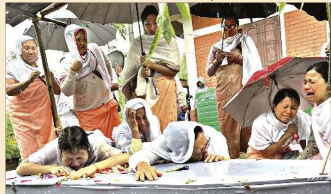
লেখিবা চহী ৫ খন্ডা শুখিবা তোমখিল য়াইসনাগী হকচাং লৌদনা চংনি লাইনীংগী ওইনাম অমসুং মহাক্লি থা ৫ খন্ডা ভুইরিবা মজুপী মতুংইনা অরোইবা ...মখা লমায় ৩ কলম ৩

ইম্ফাল, মে ০২ (এইচএনএস) : মে ৩, ২০২৩দী মণিপুরদী লেজিসলেচরগী পরার য়াওবা সিপরেট এডমিনিস্ট্রেশন লৌগনি হায়দুনা মীতৈদা অতুনা ওনশিন্দনা চখরক্লিবা তমখিরাবা লান অসি মণিপুর অমসুং য়ুনিয়ন লৈঙক্ল অরোইবা বারোইশিন অমা পুরভবদগী শাহিং-ভাং চাবা মানবা হিংচা-মাইতুদগী মখা চখরকপা থৌওদা মমাঙ থাগী ৬ অমসুং ৭কী লোম্বা অহিংগী নোংমাই মতুং পুং ১.০৫ বোম তারকপা ত্রোলাওবী অরোইবা মমাঙ মপাদল কল্লাবা বোম কাপশিন্দনা পোকখায়হল্লকপা মমাগী মখাদা তুবিবা পীক্লিবা অঙাং ২বু বোম মচেন্দা পালহনবদগী লায়কল্লাবা কনবা ভুন্দনা লেখিবা তু নুমিৎ ২৪নিগী মতুং ভুসি রিসসকী মীরেলশঙদগী থায় য়াওহল্ল মচিনা-মনাও অঙাং অনীগী হকচাং লৌদনা অরোইবা মথৌ-মঙম পাণ্ডথোকখি।