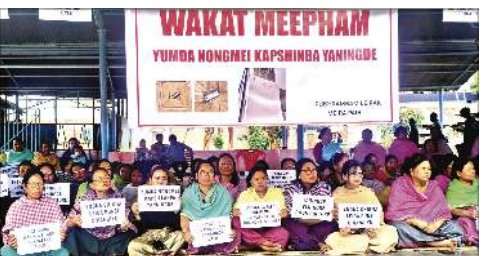
বাক্ব খোঙজদা শরুক য়াখি মেরা পায়বীগী মেহর কে ঐচ সন্ধারানিনা হায়, লৈকাযী সঁরাংনা অসুক য়োনা ফংএবা, চহী ৩ ...মখা লমায় ৩ কলম ৬