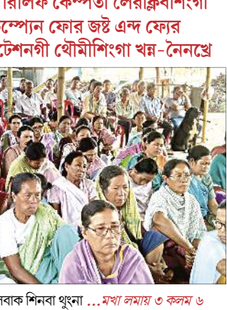
লৈবাক শিনবা থুংনা ... মথা লমায় ৩ কলম ৬

ইম্ফাল, এপ্রিল ০৩ (ঐচএনএস) : ঈরাংনা মরম ওইদুনা লাঞ্জেমরজুনা রিলিফ কেম্পশিংদা চঙজফম লৌরক্লিবা আই দি পিশিংবু মশা-মশাগী য়ুমদা হঞ্জিদ্দিবা ফাওবা মণিপুরদা সেমস পাণ্ডথোক পা য়ারোই অমসুং করিগুহা লৈঙাক্কা নম্ফুদা সেমস পাণ্ডথোকপা মতমদা আই দি পিশিংনা সপোর্ট তৌরোই অমদি মসিগী মায়োক্তা অকনবা খোঙজং কয়া চঙশিল্লকনি হায়না শজিবুগী প্রি-হেভিক্টেটেড রিলিফ কেম্পতা চঙজফম লৌরক্লিবা ইম্ফাল ইষ্ট দিষ্টিক্টকী ইকৌদগী খৌথিরোম ধনেেনা পাউমীশিংদা ফেঙদোকসে।