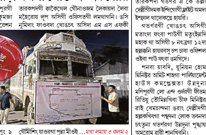
খৌমীশিং য়াওরগা পুনা মীওই ... মথা লমায় ৩ কলম ২

ইম্ফাল, এপ্রিল ০৩ (ঐচএনএস) : মণিপুরগী মাইহেরায় লুপশিংগী মনুংদা অমা ওইনা কুমজা ১৯৯৮দগী লৈরক্লিবা মণিপুরী ট্রেনেটস ফেদরেশন (এম এস এফ) না শীং দুনা 'ঐখোয় ময়ই কাবা ড্রাগ থাদোক্সিস' হায়বা কেম্প্যানগী মখাদা 'ময়ই কাবা চীপ্তাক্কা ইনখংলক্লিবা কয়গী পুন্দি কমিটি' হায়বা পান্দদা হুয়েং গাড়ী মচাগী অশংবা খোঙচং অমা চংকদৌরি।