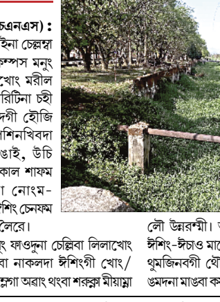
লৌ উন্নরশী। অদুবু করিগুহা নোং য়ায়া কয়া চুনা ঈশিং-ঈচাও মায়োরস্বা অমদি লৌ পাল্লবা মতুংদা ঈশিং থুমজিনবগী খৌদোকশিং মায়োরক্কাবদগী লৌ লোকপা ওমদনা মাঙবা কয়ারকয়াওসে। ... মথা লমায় ৬ কলম ৫

ইম্ফাল, এপ্রিল ০৩ (ঐচএনএস) : মতম অমদা ঈচেল নাইনা চেল্লিবা মণিপুর যুনিভার্সিটিগী কেম্পস মনুং ফাওদুনা চেল্লিবা লিলাখোং মরীল অসি মরী লৈনবা ওখোরিটিনা চহী কয়া শেংদোক্কাবদগী হৌজি খি কবো নাপীনা কুপশিনখিবা নন্তনা তীল-কাং, হঙাই, উচি অমদি লিননাংবগী মকোল শাফম ওইরকপগা লোয়ননা নোংম-নোংমগী খেংগলক্কা ঈশিং সেফম লৈরক্কাবদগী মৌখংতুনা লৈরে।