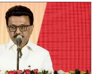
হৌনা লোল ৩ তম্বা মথৌ

নেশনাল এডুকেশন পোলিসি (এন এ পি) ২০২০ গা মরী লৈননা হন্দক সেক্টরে বোর্ড ওফ সেকেন্দরি এডুকেশন (সি বি এস সী) না মথোয়গী করিকুলামদা অহোংবা কয়া পুরকখিবু টামিল নাডুগী চীফ মিনিষ্টর এম কে স্টেলিননা য়ানিৎদবা ফোঙদোক্কাই হোংনরকখি।