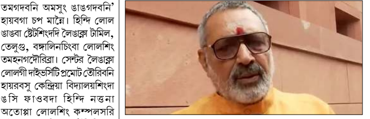
নু দেল্লি, এপ্রিল ০৪ (এজেক্সী):

মুস্লিম ওর্গনাইজেশন কয়না ইন্দিয়াবু ইম্মামিক লৈবাক ওন্সোকপা পাল্লি। মসিগীদমক মথোয়না তোঙন তোঙনবা থরক থৌরম কয়া লেপুনা পায়খলি অদু মথোয়গী মঙলান মঙফাওনরোই হায়রুনা পি এম মোদিগী টর্ম লোয়দিঙে লৈবাক শিন থুংনা 'রান নেশন রান লো' অমসুং যুনিফোর্ম সিভিল কোড (য়ু সী সী) চংনহনগনি হায়না যুনিয়ন মিনিষ্টর গীরাবাজ সিংহনা ফোঙদোকখি।