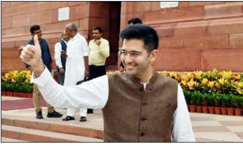
নু দেল্লি, এপ্রিল ০৪ (এজেক্সী):

আম আদমি পাটি (এ এ পি) গী রাজ্য সভাগী দেপুটিগী লিদরগী ফমদগী লৌথোকখিবা এম পি রাঘব চাখানা পাটিগী লিদরশিপনা মতমদা শোয়াদনা মায়খুম হাংদোক্কা অশেংবদু থোরক্কাগনি। মথোয়না লৌতুনুনা চখরকখিবা থৌওং অদুনা গুসি এওইস্ট ওপরেসন শোকহন্দুনা হাউ অদু হোয়া থৌনা লৈনা মীয়ামগী ইয়া পুথংখিগনি।