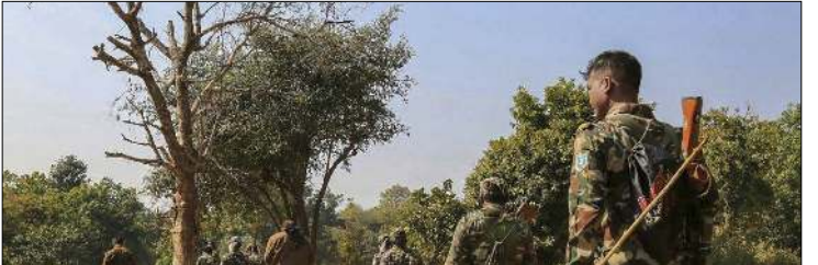
নু দেল্লি, এপ্রিল ০৪ (এজেক্সী):

ইন্দিয়াদা হোম মিনিষ্টর অমিট শাহনা মমাং চহীদা লৈবাক অসিদগী নক্কলজম অমসুং মাওইস্ট অসি মমাং থাগী ৩১ ফাওবগী মনুংদা মক ফন্বা মুথংকনি হায়না মীয়ান্না রাশক্কা মতম থাপ্ৰবা মতুংদা মার্চ ৩১ গী দেদলাইন য়ৌদিঙে যুনিয়ন হোম মিনিষ্ট্রিগী ওফিসলশিংনা অবাংবা থাকী য়েংশিন মীফম অমা পাঙথোক্কা লৈবাক অসিদা এন্টি-নক্কল অমসুং এন্টি-মাওইস্ট ওপরেসন কয়া চখিব্বা মতুংদা লৈহৌরিবা সেক্টরিক্স এক্সট্রিমিজমগী কীভ্রা কুলা য়েংশিনপ্রে হায়না এজে লিগী পাউনা ফোঙদোকখি।