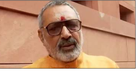
মহাক্কী রাফমসি অসামদা মীখলগা

মুস্লিম ওর্গনাইজেশন কয়না ইন্দিয়াবু ইম্মামিক লৈবাক ওন্সোকপা পাল্লি। মসিগীদমক মথোয়না তোঙন তোঙনবা থরক থৌরম কয়া লেপুনা পায়খলি অদু মথোয়গী মঙলান মঙফাওনরোই হায়রুনা পি এম মোদিগী টর্ম লোয়দিঙে লৈবাক শিন থুংনা 'রান নেশন রান লো' অমসুং যুনিফোর্ম সিভিল কোড (য়ু সী সী) চংনহনগনি হায়না যুনিয়ন মিনিষ্টর গীরাবাজ সিংহনা ফোঙদোকখি।