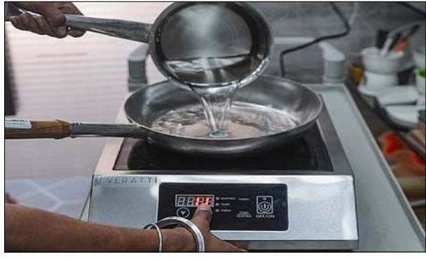
এল পি জি শিজিম্বা হস্তহনবা লৈঙাক্কা ইন্দক্কন হিটর অমসুং মসিগা চানবা ভেসেলশিং পুথোকপগী চাং হেনগংহনবা পোংলমশিং অসি মীয়ান্না লায়না ফংহনবা গুন্না হোংনরি হায়না এজেক্সিগী পাউনা ফোঙদোক্কাই।

বেষ্ট এসিয়াদা থোক্কা লান অসিনা ইনজিগী অটোবা ক্কাইসিস মায়োক্কাইঙে চৈরকসিদা মীয়ান্না এল পি জি শিজিম্বা চাং হস্তহনবা পান্দমদা ইন্দক্কন হিটর অমসুং মসিগা চানবা ভেসেলশিং পুথোকপগী চাং হেনগংহনবা পোংলমশিং অসি মীয়ান্না লায়না ফংহনবা গুন্না হোংনরি হায়না এজেক্সিগী পাউনা ফোঙদোক্কাই।