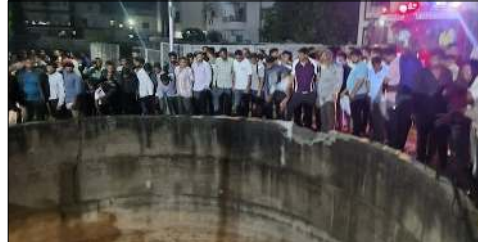
খৌদোক অদু নাসিক দিষ্ট্রিক্তকী

মহারষ্ট্ৰগী নাসিক দিষ্ট্রিক্তত য়মদা হক্কপা মীওই ৯ তোংবা গাড়ী অমা গুহাদা তাশিনবদা মথোয় ৯ মক শিরে। তুংদা মীওই ৯ অসি ইমুং অমতগী মীওইশিংনি হায়বা খঙবা গুন্না কখিবগা লোয়ননা লৈখিবশিংগী মনুংদা অঙাং ৬ য়াওরমখি হায়রি।