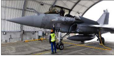
নু দেল্লি, এপ্রিল ০৪ (এজেক্সী):

ইন্দিয়াদা নোংখকী দিফেন্স সেক্টরদা নীংতয়া লৈনবা অমসুং কনাসু মীপান তান্দনবা হোংনরিঙে ইন্দিয়াদা মক্কাই ফাইটর জেট অমা ওইরিবা ফ্রান্সতগী লৈবা 'রাফেল' ফাইটর জেটকী বেসিক সোর্সেইজের ছোর্স কোদ পীরকখিছে হায়রি।