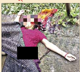
মীহাং থীনা হাংলগা ময়ূমদা মীহাং (৬৩)না শিরগা লৈরগা

ইন্ডিয়ান, মে ০৪ (এইচএনএস) : মতম খরগী মমাঙদগী যুগী নুপী খরব মশাগী ময়ূমদা অমসুং ময়ূমদগী কোথোকগা মীহাং থীনা হাংলগা থৌদোকখি থোকখিবসু হৌজিক