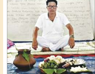
ইন্ডিয়ান, মে ০৪ (এইচএনএস) : মণিপুরদা মীচম হাংপশিং চখরক্লিবা অসি কুকি খুংলায়

আই ডি পি প্রেমজিৎনা শিদিবা ফাওবা চরা হেনবগী থোঙজং চঙশিনত্রে