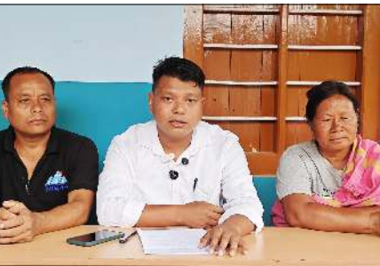
স্কুল অরর লোয়রবা মতুংদা গুমা চংখিবা অমসুং হেদ মাপ্তরনা জেদ ঙৈ ও গফিসতা ওফিসল ওইবা থবক চংখিবা মতমদা লাকপনা মরম ওইরগা মইরোয় অমদি ওজাশিং থেংনখিদিবনি।