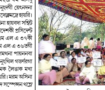
ফাওবা তংদু লৈতাবা হঞ্জিলহনবা গুডবগী অটৌবা ১৫ ৰোমদমক শুৱিবা লৈকায় ...মখা লামায় ৩ কলম ২

ইম্ফাল, ফেব্রুৱাৰী ১১ (এচএনএস) : মে ৩, ২০২৩দগী কুকি টেমৱিষ্টিংনা শীততা অতম্মনা ওনশিন্দুনা তমথিৱা লান অমা চখরকপদগী হৌজিক