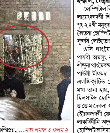
কাম্ৰমৱ, ...মখা লামায় ৩ কলম ২

ইম্ফাল, ফেব্রুৱাৰী ১১ (এচএনএস) : লিলোং হাওৱেবী মখা লৈকায়দা লৈকাই মত্ৰাসাদা ক্লাস চখরিঙেদা স্কুল অসিগী বিল্ডিং খঙহৌদনা মৈ চাৰুকপদগী মইহেৱায় অমদি ওজাশিং মীপাইনথ্ৰে হায়রি। থৌদোক থোকফমদগী ফংবা পাউনা হায়, গুসি অয়ুক ক্লাস হৌৱবা মতুং পুং ৯.১৫ ৰোম তৱকপদা থৌদোক অসি থোকথিবনি। মৈ চাৰুকপদা উৰগা স্কুলগী হেদ মাত্ৰ অমদি ওজাশিংনা খুঙদা থৌৱালগী দেপাটি