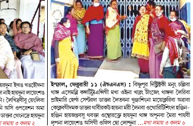
ইম্ফাল, ফেব্রুৱাৰী ১১ (এচএনএস) : বিফুপুৱা দিষ্ট্ৰিক্টকী মনুং চিল্লিবা থাম্ এসেমব্লি কৰ্মাট্টিংএলিগী মখা ওইনা থাম্ চীংজ্জং থাম্দা লৈৱিৱা প্ৰাইমাৰি হেপ্ট সেন্টৱদা ডাক্তর লৈতবনা খুঞ্জাশিংনা মায়োক্তৰিৱা অৱাৰা কোৱৰ্টৰগীদমক ডাক্তর থাবীৱক্কে হায়না মৰী লৈনবা ওখোৱিৱিৱি হঞ্জিন-হঞ্জিন হায়জবসু থবক্তা ওছোৱক্কে হায়দুনা থাম্ অপুরবা মৈৱা পায়বী লুপনা লায়শংগি অসিগী ওফিস ছো লোশুনা ...মখা লামায় ৩ কলম ৬

ইম্ফাল, ফেব্রুৱাৰী ১১ (এচএনএস) : বিফুপুৱা দিষ্ট্ৰিক্টকী মনুং চিল্লিবা থাম্ এসেমব্লি কৰ্মাট্টিংএলিগী মখা ওইনা থাম্ চীংজ্জং থাম্দা লৈৱিৱা প্ৰাইমাৰি হেপ্ট সেন্টৱদা ডাক্তর লৈতবনা খুঞ্জাশিংনা মায়োক্তৰিৱা অৱাৰা কোৱৰ্টৰগীদমক ডাক্তর থাবীৱক্কে হায়না মৰী লৈনবা ওখোৱিৱিৱিৱি হঞ্জিন-হঞ্জিন হায়জবসু থবক্তা ওছোৱক্কে হায়দুনা থাম্ অপুরবা মৈৱা পায়বী লুপনা লায়শংগি অসিগী ওফিস ছো লোশুনা ...মখা লামায় ৩ কলম ৬