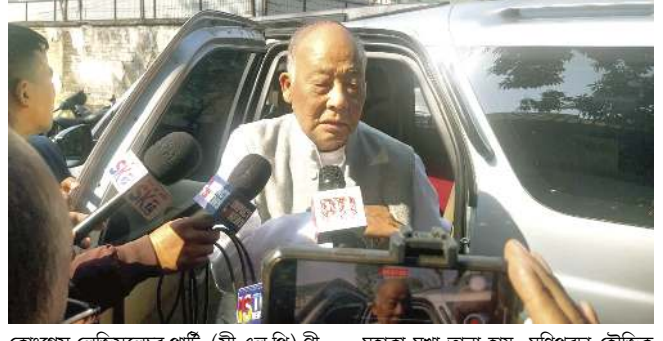
কোংগ্ৰেস লেজিসলেচর পাটি (সি এল পি) গী লিদৱ ওইৱিবা ওক্রম ইবোবীনা ফোঙদোকপে

'চীফ মিনিষ্টরদা পাউতাক পীনীংলবসু নুমিৎ ১০নি ৰোম ৰাংলিঙেদা কৌৱগা পীৱকপা য়াই, মদুদী ওম-ভেনবদা এসেমব্লি সেশন হৌগদবা নোংমখক্তা গুইৱবা মতমদা মখোয়না তৌৱক্কা থৌওং অসি পেমীংগুই ওইদে'