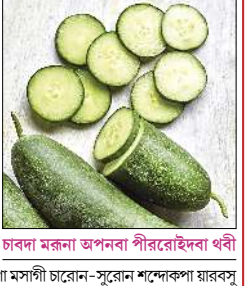
চাবনা মরুনা অপনবা পীরেইবাধা থী

মরু যাওহন্দ্রবা উহয়শিংগী মথং চারোন-সুরোনগীদমক মরু পুথোকপা