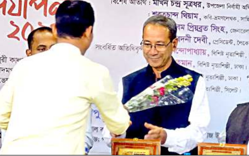
সৱত্ৰতম থিয়ামদা লৈপুন খুলা তৌবা