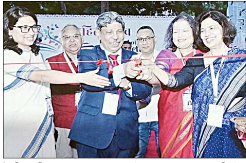
সৱত্ৰতম থিয়ামদা লৈপুন খুলা তৌবা