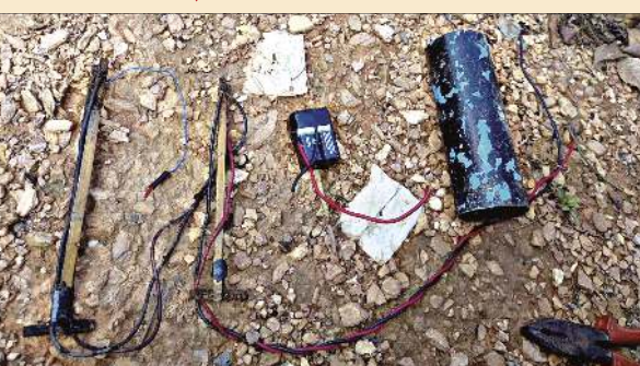
কামজোং দিষ্টিকী চছাদ পুলিস ষ্টেশনদরী নোংপোকলোমদা কিলোমিটার ৫০ রোমদমক লাপুনা ম্যান্নার মনুংনা লৈবা মোলনোই কুকি খুলগী যুমশিং মৈ থাৰা (ওই) কসোম খুলেন দিষ্টিকী নমলি খুলগী বোদরগা তাইনবা মফম্মা কে এন এ-বিনা প্লান্ট তৌরনৈ আই ঈ দি

ইম্ফাল, মে ১২ (এইচএনএস) : থা অসিগী ৭কী অঙনবা অয়ুজী হৌরদুনা ইন্দো-ম্যান্নার ঙমথে পরিংদা লৈবা মণিপুরগী কামজোং দিষ্টিকী কসোম খুলেন অমসুং চছাদ পুলিস ষ্টেশনদরী জুরিসডিকশনশিনা কোনবা নমলি, বাংলি অমসুং জেদ চোরো খুলনা ঙমথে লামা ম্যান্নারোমদগী চঙশিল্লকপা কে এন এ-বি/পি দি এককী মশীঃ য়াম্বা কাদরশিংনা কৈথেল যাওনা যুম-কৈশিং, গাডী মচা অমসুং অটোবনচিবা মৈ থাদোকখিবা অমসুং মণিপুরদা চঙজফম লৌদুনা লৈরকখিবা ম্যান্নারগী নুপী অমবুসু শোকহল্লকপা লোয়ননা খুঞ্জা খরদা নক্তা গাডী অমসুং পোং-চৈশিং মুনুনা পুখিবগী যৌদোকখিং থোকপ্তবা মতুংদা ম্যান্নারগী ঙমথে মনুংনা লৈবা কুকিখিংগী 'মোলনোই খুল' গী যুমশিং মৈনা তুয়া থাদোকখে। যৌদোক অসিগী মতুংনা পাউচে অসিনা ফংবা রিপোর্টখিগী মতুংইয়া যুম মৈ থাদোকপগী যৌদোক অসি মণিপুরগী কামজোং দিষ্টিকী চছাদ পুলিস ষ্টেশনদরী ... মখা লমায় ৩ কলম ২