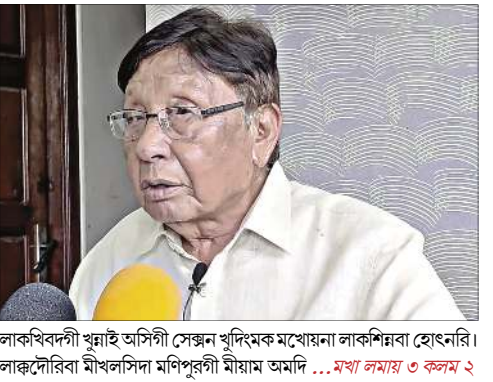
লাকখিবদগী খুই আই অসিগী সেক্সন খুদিংমক মখোয়না লাকখিমা হোংনরি। লাক্কাৰিবা মীখলসিদা মণিপুরগী মীয়াম অমদি ...মখা লমায় ও কলম ২

ইম্ফাল, জুন ১২ (এইচএনএস) : চীফ মিনিষ্টর বিমেন ইকনমিক এম্প্লোয়মেন্ট স্কিমগী লুপা ক্ৰোর ৩৫০ এর মার্ক তৌরিবসি ভোট খোম্বগী পাশ্বে ওইনা তোঙান-তোঙানবা এম এল এশিংনা মখোয় মখোয়গী এসেমব্লি কসটিটুএলিগা চখরক্কাৰি হৌও অসি ইলেক্সনগী ওফেন্স অমনি হায়বগা লেয়ননা হন্দকী ইলেক্সন অসি এম এল এ ময়ামগী লন-থুম লেপুবা নও, মৈ চাক্কাৰি ইমা লৈবাক ইরমদ অসি কন্বগী ইলেক্সননি হায়না ভেটরেন পোলিটিসিয়ন ও জয়না ফোঙদোকপে। স্কিম অসিগী মতাদ্দা ওঁসি মহাক্কা গৰ্ভরদা অইবা চেৱেল অমা পীশিন্দনা মীংয়েং চঙবীনবা রাখংখিবাগা মৰী লৈননা কক্কা হুইদ্রোম লৈকায়দা লৈবা মহাক্কা য়মদা পাণ্ডথোকপা পাউলী মীফমদা ৰাফমশিং অসি ফোঙদোকপেদা মহাক্কা মখা তানা হায়, লমদমসিদা থোকখিবা মীহাং-মীপুদগী থৌদোকসিদা বি জে পিগী লুজিবশিং তুমিমা লৈশিল্লি। বি জে পিনা লুজিলা ওঁসিগী সেন্টরগী লৈজাক অসিনা মণিপুরগী মীয়ামু হৌশাদে হায়বসি মখোয়না চখরিবা হৌও অসিনা ময়েক শেংনা তক্কা। মণিপুরদা বি জে পিগী লৈজাক