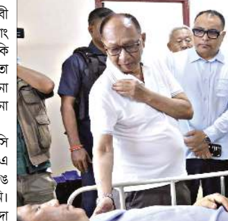
এম্বুশতা লেখিবরা রিলসন থাদাগী হককা গাড়ী মনুংদা লেবা

মহাক্কী লোয়নবীগী মিংনা খৌইরৈথে থাদা (৪৮) কৌই অদুগা ড্রাইভরগী মফিমনা ওলিড জাতুং (৪২) অপোকপা বংনেটসিং জাতুং কৌই। মহাক্কী দোলান চিক্লেদগীনি হায়রি।