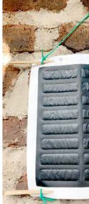
এণ্ডেক্সিট টাৰ্গেটেড সুগাৰ বাইট (এ টি এস বি) পু য়াদুনা শীজিবনা। হৌজিক বাইট অসি মালি, জায়িয়া অমসু কেমিয়াদা শীজিবনা মতমদা কায়বা ফংবগী পাউদম লৈরে।