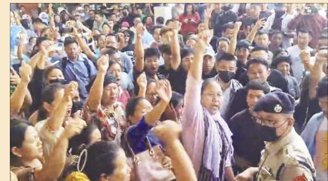
নোংমৈ মরুনা পাল্লাবা কুকি মিলিটেন্ট রিমসতা লায়েংনবা পুরকপগী মায়োজো হৌরকখিবা মীয়ায়ু (ওই) মীয়ায়ু লাকশিন্নবা রিমস কেম্পসতা টিয়র গ্যাস সেলশিং কাপ্পা

শোল্লাবা নহা অহমগী মনুংদা পাওগৌলাল চোংলোইদি মোহন বগান সুপার জাইন্ট (মোহন বগান এস জি) দা মিদফিল্ডর ওইনা ফুটবোল শাল্লিবা প্লেয়রনি। মহাক ময়ুমদা ছুটি চংখিবা হায়রি। অশোকপা অহমগী মনুংদা অনীগী ফীভম লুবদগী ওপরেসন পাঙথোকপা হৌথ্রে