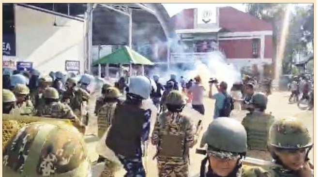
রিমস কেম্পসকী হৌদোক অসি ওসি খুদিংমক্কী তেঞ্চাক লেঙকো পুগাদবনি। লৈখিভ্রবা নাগা মীচম তরকপা মীহাং থীনা হাংপুবা মতুংদা নোংমৈ কাপ্পদা শোকপা কুকি মিলিটেন্ট অহম রিমসতা পুরকপদা লায়েংলিবা মীয়ায়ু অপাহুগী মায়োজো হায়না অসম অমসুং নাগা রিমেন যুনিয়ননা ফোঙদোকপে।