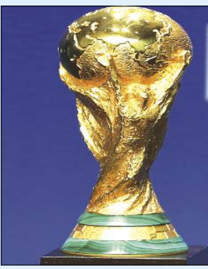
অনীশ্ববা লগ্জাওগী মনুং চহীশিংঃ

ফিফা বর্ল্ড কপ অসি কুমজা ১৯৪২দা পাঙথোকবা খোরান্গা তৌখি। বর্লিন্দা, কুমজা ১৯৩৬ কি ওগষ্ট ১০দা পাঙথোকখিবা ২৩ শ্ববা ফিফা বর্ল্ড কপেংসেংসেং, জর্নিনা কুমজা ১৯৪২গী ফিফা বর্ল্ড কপকি য়ুসু ওইনবা ওফিসিএল্লি এপ্রাই তৌখি। ব্রাজিলনসু কুমজা ১৯৩৯গী জুনদা টুর্নামেন্ট অসিগী য়ুসু ওইনগা হায়না এপ্রাই তৌখি। কুমজা ১৯৩৯গী সেপ্টেম্বর ১দা নাজি জর্নিনা পোলেন্দা লান্দাদুনা মালেমগী অনীশ্ববা লগ্জাউ শোক্কা হৌখি অমসুং ১৯৪২গী অসিগা লোয়না য়ুসুইটেইং কিংদম অমসুং ফ্রান্স নাজি জর্নিনগী মখতা লান লাউথোককপদগী য়ুসু ওইনগা লৈবাক অমা খনবা নাজিগী কুমজা ১৯৪২ ফিফা বর্ল্ড কপকি মখা তাবা খোরান্গা অদু তোকপা তাখি। মালেমগী ২ শ্ববা লগ্জাউ মনুংদা ফিফানা হিংদনা লৈবা ওইনবা কমা হোংনখি অমসুং লান লেইনবা মনুংদা হিংন-চিহ্না টুর্নামেন্ট অমা পাঙথোককপদগী মখতা খোরান্গা পায়খনবা শেলনত্রগা পার্সনেল রিছেসিংশিং মশাদা লেখিদি।