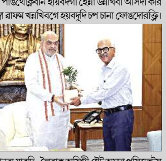
পনবা য়াবদি, লৈবাক অসিগী