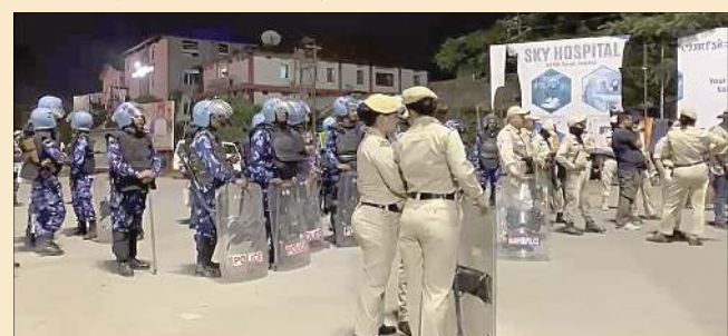
কুকি মিলিটেন্টনি হায়বা নোইমৈ মরুনা পানবা নহা ৩ রিমসতা লায়কন্নরহা নোইমৈ মরুনা পানবা নহা ৩গী মমিং-মথা রিমসকী 'মেদিকো-লিগেল কেস' (এম এল সী) গী রেজিষ্টরদা চল্পমদ্রে

লায়কন্নরহা কুকি মিলিটেন্টনি হায়বা নহা ৩গী মমিং-মথা রিমসকী 'মেদিকো-লিগেল কেস' (এম এল সী) গী রেজিষ্টরদা চল্পমদ্রে