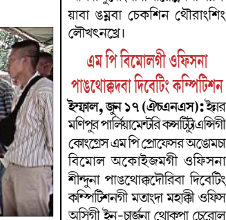
ইম্ফাল, জুন ১৭ (এইচএনএস) :