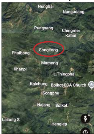
খোল্লিবা মফম অদু হেংলেপ সব-দিভিজনগী মনুং

ইম্ফাল, জুন ১৭ (এইচএনএস) : ওয়াং নুংখিল পুং ৪.৩০ রোম তারকপদা চুড়াচান্দপুর অমসুং নোনে দিষ্টিক্কী ওইনা কনফর্ম তৌননবা ওসি নুমিদাং