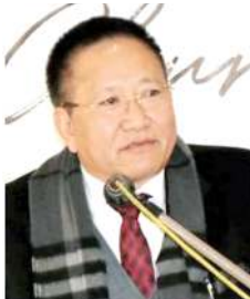
সোইখিংগী মত্ৰা ইয়া ব়াৰেপ অদু এন পি এফনা নিংখোক্কাৰিবা নুমিতা নিমাপুৰদা পাওখোক্কাৰিবা মীফম অমদা লৌখি। এন পি এফনা নেসেলিষ্ট দেমোক্রেটিক প্রোগ্ৰেপ্পি পাৰ্টি (এন পি পি পি), বি জে পি অমসু ইন্ডিপেন্দেণ্ট অমা য়াওদবা কল্লিং কোলিসনদা ইনৌবী মত্ৰা ইয়া য়াওশিম্বাৰিবা নাগালেন্দ ওপোজিসন য়াওদবা গভৰ্ণমেণ্ট অমসু উৰা ফলগনি।