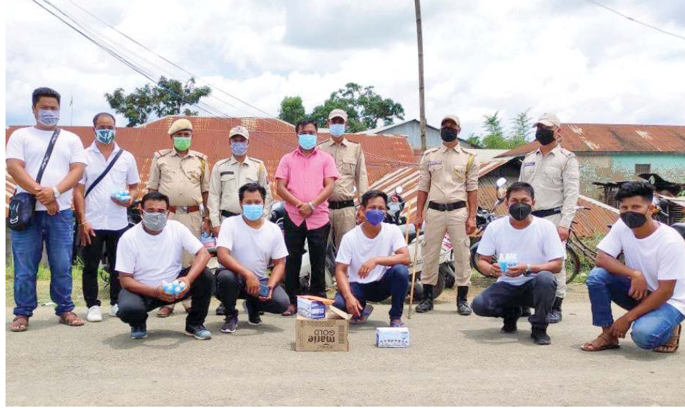
তমখিৰবা কোভিড-১৯ গী সেকেন্দ বেড অসিনু ডাক্খোক্কাৰিবা লৌমীশিংগীদমক হোংনরি দি সীগী মীংয়েং মখাদা শেমখিবা কোভিড-১৯ টাক্কাৰ্শে তেহুগী য়ৌমীশিংগীদমক সোসাল এন্ড কলচরেল এজিউক্কাৰ্শে নোংপোক লুপা ৫,০০০ গা লোয়ননা হেদ সেনিটাইজর অমদি ফেস মাক্কাৰ্শে খুংশিমখিবা

শিলোং, জুলাই ২০ (এজেন্সী): লৌমীশিংগীদমত্ৰা মেঘলয়া লৈঙাক্কা মতম পুস্বদা লেপনুনা লৈরি অমদি লৌমীশিংগী চাওখং য়োরাংগীদমক তোঙান তোঙানবা মখলগী প্রোজেক্টশিং পায়খংনবা হোংনরি হায়না চিফ মিনিষ্টর কোনরাদ কে সংমানা ফোঙদোক খিবগা লোয়ননা লৌমীশিং য়োকখংপা হায়বসি লৈঙাক্কা অসিগী অমতা গুইরিবা পামদনি হায়রি। ই ষ্ট্ৰ গাট্ৰা হিলসত পি পাওখোকখিবা লৌমীশিংনা উন্নবগী য়ৌরম অমদা কোনরাদনা রাফম অসি ফোঙদোকখিবগা লোয়ননা গ্রাস রুট লেভেলদনী হৌরগা লৌমীশিংনা মায়োক্কাৰিবা খুদোচাদবা কয়্য অদু কোক্কাৰিবা মহাক্কা লৈঙাক্কা হোংনরি। লমদম অসিদা লৈরিবা লৌমীশিংনা পোখোক্কা হোমো পুথোক্কা শেফে দাং হোমো তালহয়বগীদমক তোঙান