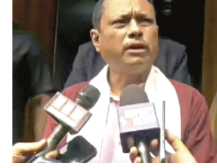
ইন্টরনেশনাল মাদর লেংখেজ দেগী সিলডর জুবিলিগী থৌৱম পাঙথোকপদা অথোইবা মীথুংলেন ওইখিবা এম পিনা ফোঙদোকখিবনি। থৌৱম অসিদা শরুক য়াখিবা এম পিদা পাউশিংদা হংবা হাংগী পাউখুমদা মহাল্লা হায়, লমদমসিদা পোকপা অমা ওইনা চহী অনি হৌয়া মীয়ামা মেশা লাংলে অমসুং ৱাৱে হায়বসি খঙই। কীভম অসিদা পোলিটিকেল গেম কা হোয়া তৌবা ফতে। অথুবা মতমদা সোলুশন অমা পুৰতুনা ঐখোয় লিংজেল ...মখা লমায় ৩ কলম ৭

ইম্ফাল, ফেব্রুৱাৰী ২১ (ঐচএনএস) : খুল ঙাকপা ময়াম ফারিবসিগী মরম শোয়দনা থিগাংলক্কনি হায়বগা লোয়না খুল ঙাকপাশিং অসি মতৌ কয়ামা থোকহল্লক্কখিবনে হায়বা হাং হংলদুনা রাজা সভাগী এম পিসু ওইরিবা নিংথৌ লৈশেন্দা সনাজাওবনা ষ্টেট অমসুং সেম্বেল ফোর্সনা ইনএক্টিভ ওইবদগী খুল ঙাকপাশিং থোরকখিবনি হায়না ফোঙদোকপে। রাফম অসি ওসি রিমস হৌৱ মণিপুর (রিমোম) অমসুং জি পি রিমোম কোলেজনা পূৰ্ণা শীন্দুনা