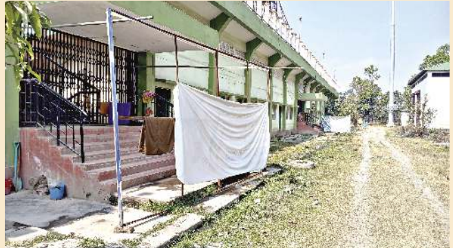
ফেব্রুৱাৰী ২১, ২০২৫দা ওইহোবা হোকি ষ্টেডিয়মগী শরুক অমগী শক্তম

ইম্ফাল, ফেব্রুৱাৰী ২১ (ঐচএনএস) : ষ্টেট ২৮ অমসুং যুনিয়ন টেবিলি ৮ লৈরিবা চাউরবা লৈবাক অসিগী মনুংদা শায়-খোংনবগী লমদা মতিং লৈবা শায়রোয়শিং পুথোকপা ওস্কোরদমক মণিপুরবু স্পোর্টসকী পরার হাউসনি হায়নরকপগা ইরোয়ননা লৈবাক অসিগী ইহান হানবা স্পোর্টস যুনিভার্সিটি ফাওবা ষ্টেট অসিদা লিংলক্কবসু স্পোর্টসকী পরার হাউসনি হায়বা রাফম অসিবু মশেন-মরাং উহন্নবা হোংনবা যাওররা হায়বগী হাংন চোঙথোকুরা