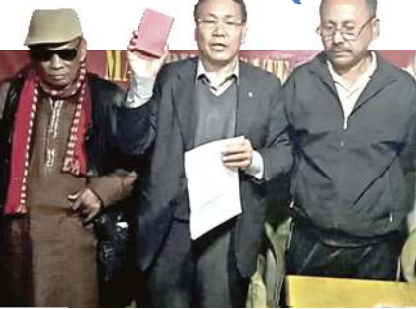
লাঙ্গোল পল্লিকেশননা শীন্দুনা সী পি এমগী ওফিসতা মালেমগী মফম পুনমত্তা ইন্টারনেশনাল যুনিয়ন ওফ লেফট পল্লিশরনা শীন্দুনা পাঙথোকখিবিগুম 'রেদ বুজ' দেবী থোরম পাঙথোকখিবা