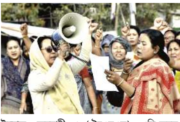
ইম্ফাল, ফেব্রুৱাৰী ২১ (ঐচএনএস) : ওসি অয়ুক অঙনবদা ৪৬-এ আরনা ককচীং রাইরি পঞ্জাও পানলুদা লৈবা এ টি যুনিট-২ ৬কী কেম্পসতা তেঙ্গোল্লোই ২৬ ফাজিল্লুবদগী পুৰবগী পাউলায়ে চাকপদৌনা তম্পাকী মফম শিনবা থুংনা শান্দোকুরকপদগী হৌনক্কা তৌদনা মীয়াম মরু ওইনা নুপীশিংদা তম্পাকী মফম কয়াদা থোরতুনা য়ানীংদবা ফোঙদোকপে।

থোম্মা অনীৱজ্ঞা খাদোরক্কে হায়বগী ষ্টেশনখি। অদুনা ওইনমক নুমিদাংগী মতামদসু মৌরা পায়বিশিংনা নুংখিলদা খোঙজং চঙশিমখিবা মফমশিংদা মৌৱাগী খোঙজং চৎতুনা খুল ঙাকপাশিং ফবা য়ারোই, প্রসিদ্দেটস রুলগী মতুং মণিপুরগী অমৌবা লৈঙাক অথুবা মতমদা শেমগদবনি হায়বা যাওনা খোলাওশিং লাউখি। অদুর ওসি নুমিদাং অথোংবা ফাওবদা থোকহমীংদবা যৌদোকশিং থোকপগী পাউ লৈখিদে অমসুং মীফা মীপুন যাওখিদে। অমরোমদা, ওসি অয়ুক অঙনবদসু লমশাং পি