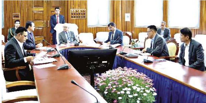
গভর্নর অজয় কুমার ভল্লানা ওল্ড সেক্রেটারিএটকী কনফরেন্স হোলদা রিভিউ মীটিং পাঙথোকখিবা

ইম্ফাল, ফেব্রুৱাৰী ২১ (ঐচএনএস) : মমাঙ থা রাশক লৌবগা পছন্দনা ফম অসিগী থক-খোরমশিং জনুৱাৰী ৩, ২০২৫দা মণিপুরগী গভর্নর ওইনা পাঙথোকপা ...মখা লমায় ৩ কলম ২