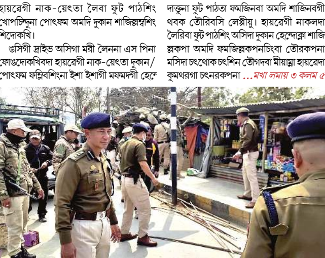
হায়ৱেগী নাক-য়েংতা লৈবা ফুট পাঠশিং খোপচিন্দুনা পোংফম অমদি দুকান শাজিৱনশিং শিলোকখি।

ইম্ফাল, ফেব্রুৱাৰী ২২ (এইচএনএস) : টিদিম লম্বী পৰিৎগী কেশাস্পাং জন্মশনদগীনা ইন্স্কানগী মনি মন্দির ফাওবগী মনুন্দা লম্বী অসিগী নাক-য়েংতা লৈৱিবা ফুট পাঠশিং খোপচিন্দুনা দুকান অমদি হোটেল ফমজিনবা যাওনা মানা-মানা পাস্তা মনুন্দা শীজিৱনকৰণগী মায়েজনা ৱাক্ষমকৰণদগী পাউচে অসিনা হকথৎখ্লেনা য়েংশিল্পৰবা মতু থা অসিগী ১৯দা মৰীক চুহ্না ৱিপোট অমা মীয়ায়দা থমজৰা মতু মথংগী নুমিংতা ইম্ফাল ৱেট্টকী ট্ৰাফিক পুলিসকী এস পিনা লুচিবগা টিম অমনা অকনবা থবক লৌখৎলকখিবগা ইরোয়ননা থৌবালদসু দিষ্টিক্ট অসিগী এস পি, এস ইবোমচানা লুচিবা টিম্বা ওসি নেশনাল হায়ৱেগী নাক-য়েংতা লৈবা ফুট পাঠশিংখু খোপচিন্দুনা লামা শীজিৱন মীওইশিংগী মখক্তা অকনবা দ্ৰুহিত চখবা হৌখ্লে।