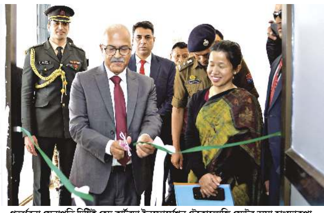
গভর্নরা সেনাপতি দিষ্টিক্ট হেড কাৰ্টৱদা ইনফোৰ্মেশন টেকনোলজি সেন্টর অমা হাংদোকপা

ইম্ফাল, ফেব্রুৱাৰী ২২ (এইচএনএস) : মমাঙ চহী ২০২৪গী দিসেম্বৰ ২৪দা এপোই টেমেন্ট পীৰকল্পবা মতু মমাঙ থাগী ৩দা মণিপুরগী গভর্নর ওইনা রাশক লৌবদগী ফম অসিব পূৰ্ণক্ৰিবা অজয় কুমার ভল্লানা চুড়ানন্দপুর অমসুং মোরেদা চংখ্লে মফমশিং অদুগী সী এস ও লুচিবশিং অমদি দিষ্টিক্ট এডমিনিষ্ট্ৰেশনগী ওফিশলশিংগা হকথেননা উনদনা ৱাৰী শাশ্ত্ৰবা মতুং ওসি কাংপোকপী অমসুং সেনাপতিদসু চংখ্লে দিষ্টিক্ট অনীমজ্ঞা ইনফোৰ্মেশন টেকনোলজি (আই টি) সেন্টর অমমম হাংদোকখিবগা লোয়ননা নেশনাল হায়রে দিভেলপমেন্ট প্রোজেক্টকী মখাদা করি কল্পনা থবকশিং পায়খৎলবগে অমসুং লো এন্ড ওর্দরগী ফীভমদা কল্পনা ফীভমদা লৌবদগে হায়না মৰী লৈবাবা ওফিশলশিংগা তকখৎখ্লে।