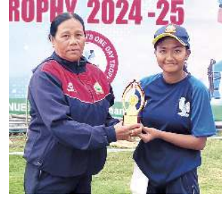
ৱন মশীং যামহুৱা হোংনৰম্ববসু লেমহৌৱিবা বেটসমেন অমতা দিজিট অনী শুনা ৱনশিং লৌবা গুমাথিবদনী ওভর ৩২.১ লৌইবদা টিম

ভূসি অমুক অভনবদনী হৌৱগা থাও গ্ৰাউন্ড থাংমৈবদদা ফোর্স অমসুং অল অমিনগী মৰজা শান্নাথিবা মেটচ অদুগী টেস ফোর্সনা গুমাথি হাৱা ফিল্ডিং তৌনবা খনথিবদনী অহানবা ইন্টিংসতা অল অমিননা বেটিং তৌদুনা শান্নাথি। অল অমিননা বেটিং তৌদুনা শান্নাথিবা ইন্টিংস অদুগী ওইনা টিম অদুগী বেটসমেন নাঞ্জিয়া বেগমনা বোল ৮৮ মায়োক্তা বান ৭৫ লৌদনা টিমগী