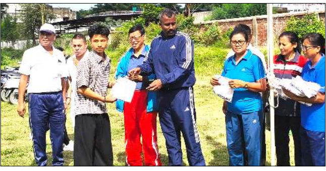
এসোসিয়েশন অসিদা এফিলিয়েট তৌরবা দিল্লিট অসিদা তোঙান তোঙানবা এসোসিয়েশনশিং অমদি মণিপুর এমেচর থো-থো এসোসিয়েশনগা যুগ্মশুধু মণিপুর ইন্টরনেশনল ওলিম্পিক দেগী থৌরম পাক শনা পাঙথোকুয়ে।

ফিলা অমা কল্পি। মণিপুরগী শানরোয়শিং যাওদ্রবদি ইন্দিয়ান কন্টিজেন্ট মপুং ফাৰা ওল্লোই। মণিপুরগী মফমশিংদা ইন্টরনেশনল ওলিম্পিক দেগী থৌরম পাক শনা পাঙথোকুয়ে। ইন্টরনেশনল ওলিম্পিক দেগী থৌরম পাক শনা পাঙথোকুয়ে। ইন্টরনেশনল ওলিম্পিক দেগী থৌরম পাক শনা পাঙথোকুয়ে।