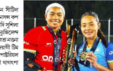
ইন্টরনেশনল ওলিম্পিক দেগী থৌরম পাক শনা পাঙথোকুয়েম এক আই এচ ব্ৰিমেস নেসল কপ ২০২৬ত মণিপুরগী বিচু খরিবম অমদি সুশিলা চনু পুত্ৰম য়াওবা ইন্দিয়ান টিমনা যুগ্ম নুজিলেণ্ড মায়কৈদগী পীরক্কি।

নুজিলেণ্ডনা যুগ্ম ওইননা ওকলেন সিটিদা পাঙথোকুয়েম এক আই এচ ব্ৰিমেস নেসল কপ ২০২৬ত মণিপুরগী বিচু খরিবম অমদি সুশিলা চনু পুত্ৰম য়াওবা ইন্দিয়ান টিমনা যুগ্ম নুজিলেণ্ড মায়কৈদগী পীরক্কি।