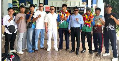
ইন্টরনেশনল ফেডাৰেশন এফ এম এ অমদি ইন্টরনেশনল স্কুল ফেডাৰেশন (আই এস এফ) ক পুৰীয়া খুশমগা থা অসিদা ১৩তী ২১ ফাওৰা মালেসিয়াগী কোলালম্পুদা অহানবা ইন্টরনেশনল ফেডাৰেশন ওফ মাইএথাই স্কুল বৰ্ডে চেন্নৈশিংদা মালেসিয়াদা পাঙথোকুয়ে।