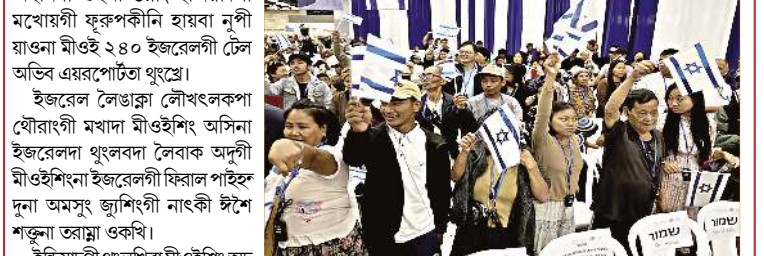
মণিপুর ১সুং মিজোরামদগী ইজরেলদা মীওই লিশিং ৬ লোম হুল্লকহমবগী থৌরাং অহানবা ওইনা মীওই ২৪০ রোম টেল অভিবতা থুংখ্রে...