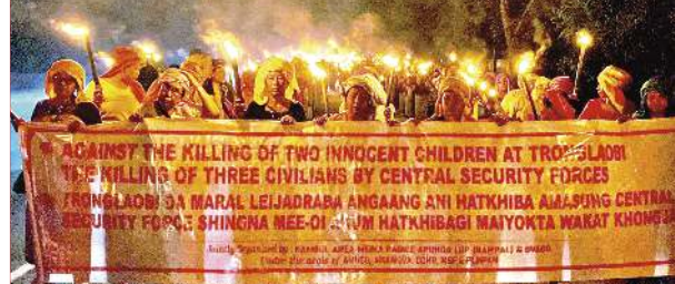
হালকপগী থৌওং চখরকপবু য়ানীংদবা নুদিদাংবাইরমদগী হৌরদনা নুদ্বোল এরিয়া...