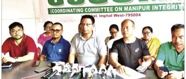
মণিপুর লৈঙাক্সা রাহং ৬ হংবা মেমোরোং কনভিনর রাই কে থিরেননা গুসি নুংখিল...