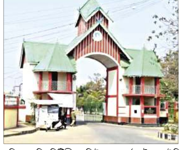
মণিপুর য়ুনিভার্সিটিগী রিক্ৰুটমেন্ট, গভর্ণমেন্ট ওফ ইন্দিয়াদা মিনিষ্ট্রি ওফ এডুকেশনগী দিশাৰ্টমেন্ট ওফ হায়র এডুকেশনগী সেক্ৰেটরি অমসুং য়ুনিভার্সিটি গ্রান্টস কমিশ্যন (য়ু জি সী) গী চেরমেননি।