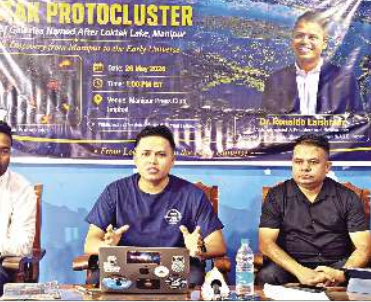
অমা থেংনবদগী করিগুন্না লোজাক পান্ধা কেশিল্লক্কা... মূংত্রবসু মালেসিাদা মণিপুরগী ফিলা অমা কন্দুনা থল্লম্ভা...