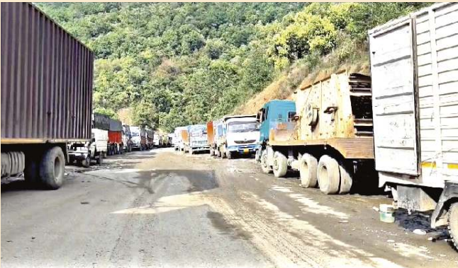
সেনাপতি দিষ্টিক্কা ফাওনুনা চংলিবা ইম্ফাল-দিমাপুর লম্বী পরিংদা পন্দুনা লৈরকপা গাড়ীশিং (ওই) পন্দুনা লৈরকপা মমায় লৈদুনা দিমাপুররোমদা হম্মাখিবা