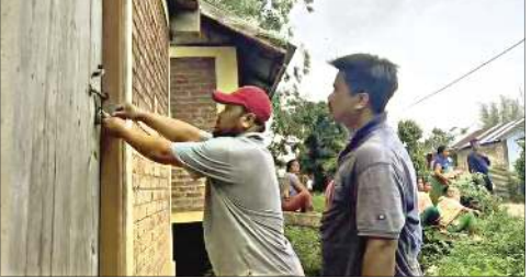
ইম্ফাল, মে ২৬ (এইচএনএস) : মণিপুর রিজবদগী ঈশিং জিখংলগা...